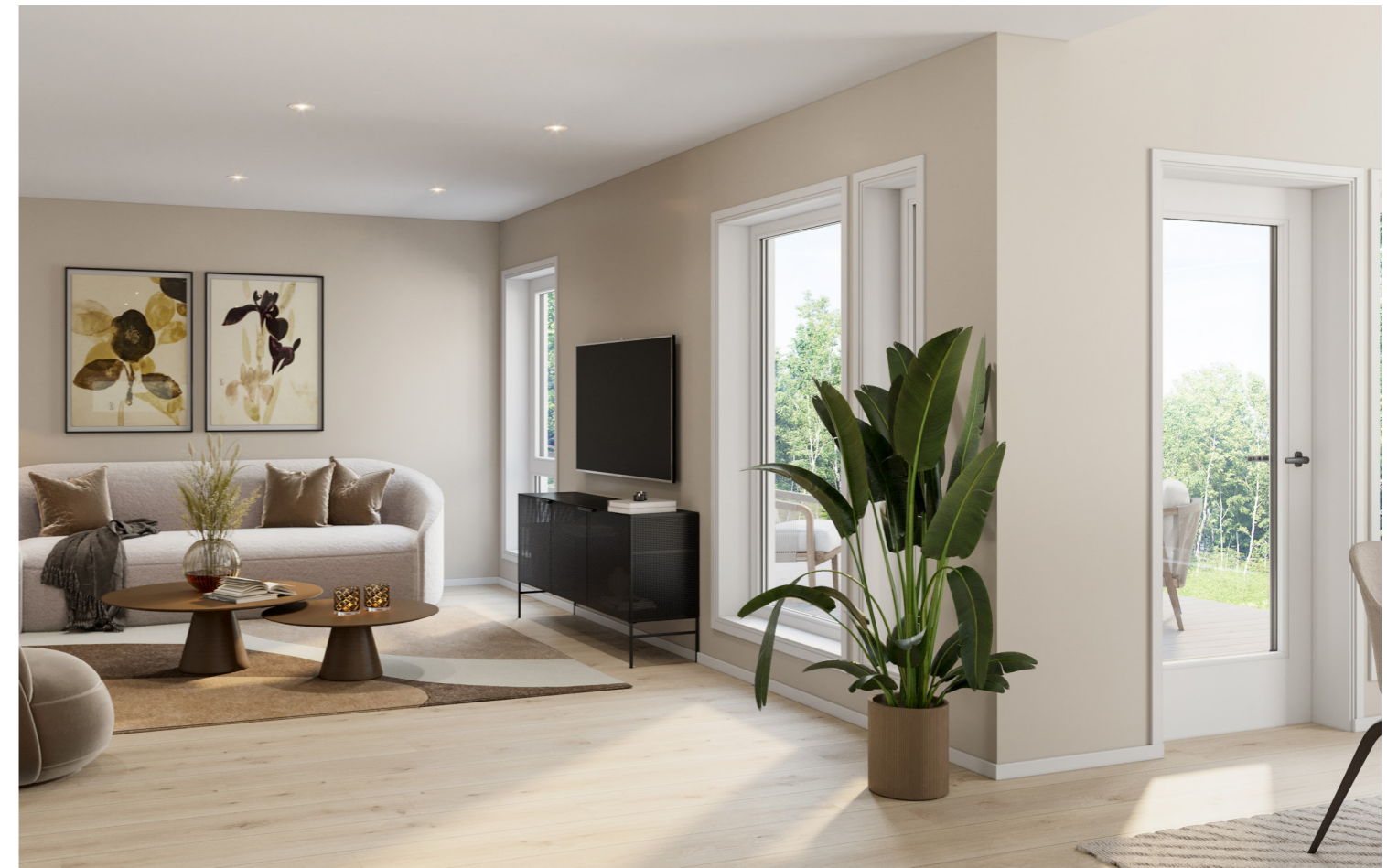
Veggfarge Washed Linen leveres som standard.